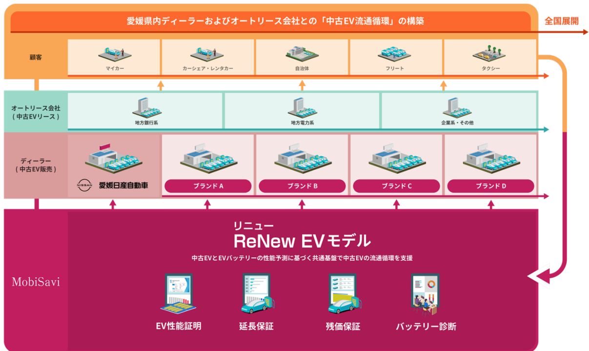
図2. 愛媛県における「ReNew EV」モデルのマルチブランド展開